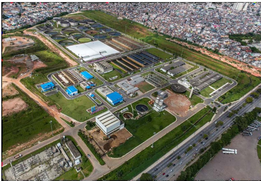
Figura 3: Aquapolo Ambiental.

A condução da água de reúso para o Polo Petroquímico demandará a construção de uma adutora de aço com cerca de 17 km de extensão, que passará pelos municípios de São Caetano do Sul e Santo André até chegar ao polo petroquímico em Mauá (SILVA, 2012).