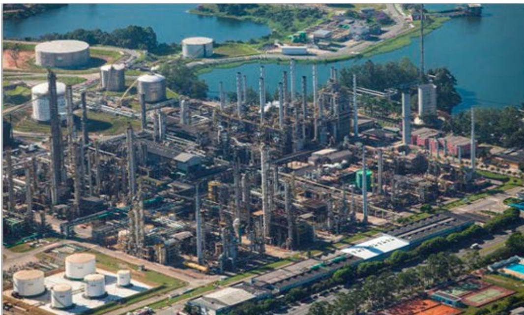
Figura 2: Polo Petroquímico de Capuava.

produção, marcando o início da consolidação do setor na região. Foi viabilizado via capital privado de um grupo empresarial de São Paulo (grupo União) com parceria do governo e capital estrangeiro, modelo que ficou conhecido como "modelo Tripartite". O capital estatal foi representado pela Petroquisa, subsidiária da Petrobras para o setor petroquímico. O capital estrangeiro foi importante para agregar tecnologia. Hoje é composto por indústrias que produzem petroquímicos para a fabricação de resinas termoplásticas, borrachas, tintas, entre outros. A central petroquímica possui capacidade de produção de 700.000 toneladas de eteno. Atualmente o Polo Petroquímico do Grande ABC é formado por cerca de 14 empresas de primeira e segunda geração que alimentam centenas de indústrias químicas e plásticas espalhadas por toda a região. Na figura 2 pode-se observar o Polo Petroquímico de Capuava.