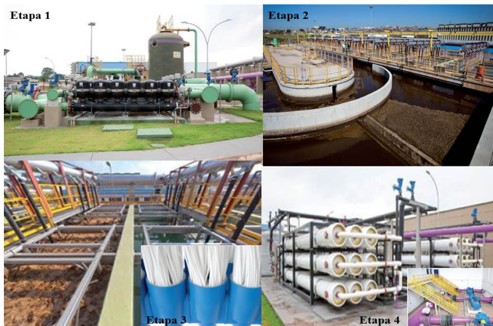
Figura 4: Etapas de produção de água no Aquapolo.

As etapas de produção de água no Aquapolo são apresentadas em quatro etapas, conforme a figura 4.